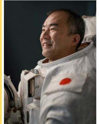
野口聡一宇宙飛行士

野口宇宙飛行士は、現在 JAXA に所属している7人の宇宙飛行士の1人です。平成8年に宇宙飛行士候補生に選定され、NASA やロシアのガガーリン宇宙飛行士訓練センターで訓練に参加しました。平成17年にはISS（国際宇宙ステーション）の組み立てミッションのため、スペースシャトル「ディスカバリー号」に乗りこみ、日本人で初めて、ISSでの船外活動を行っています。さらに、平成22年にはISSの長期滞在クルーとして163日間宇宙に滞在しました。このときはロシアの宇宙船ソユーズに、日本人初のフライトエンジニアとして搭乗しています。そして、令和2年10月末、クルードラゴンに搭乗して3度目の宇宙飛行に旅立つ予定です。55歳での搭乗は、日本人宇宙飛行士としては最年長となります。