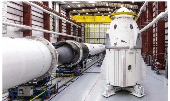
ファルコン9(左)とクルードラゴン(右)

クルードラゴン宇宙船は、アメリカの民間企業SpaceX社（Space Exploration Technologies Corp.）が開発した有人宇宙船です。スペースシャトル退役後、ISSへの宇宙飛行士の輸送手段はロシアの宇宙船ソユーズだけでした。そこでNASAは民間開発の宇宙船を利用することで、ISSへの宇宙飛行士の輸送手段を手に入れたのです。クルードラゴンは令和2年5月の試験飛行で、民間の有人宇宙船として初めて宇宙飛行士を乗せてISSに到着しました。野口宇宙飛行士は日本人で初めて、クルードラゴンに搭乗する予定です。