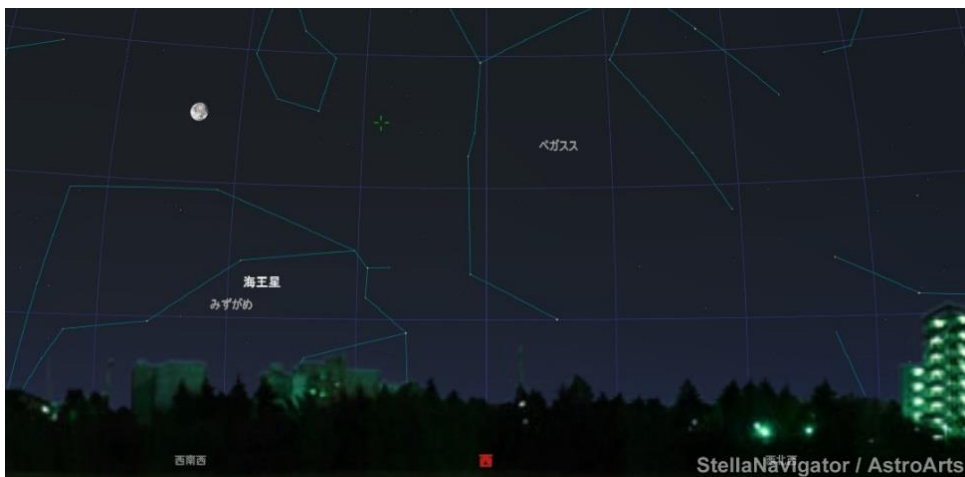
画像:9/17 3:56 久留米市 西の空 ステラナビゲータ ver.10 で作成