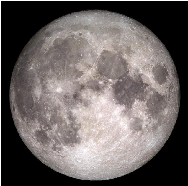
FULL MOON