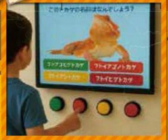
生き物クイズに挑戦!