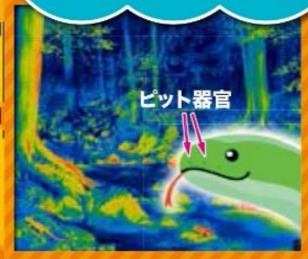
ハビのピット器官の能力を体験!