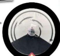
7月5日~7月26日 ベンハムのコマ