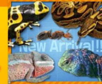
毎週新しい生き物が登場!