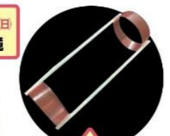
9月6日~9月20日 リング飛行機