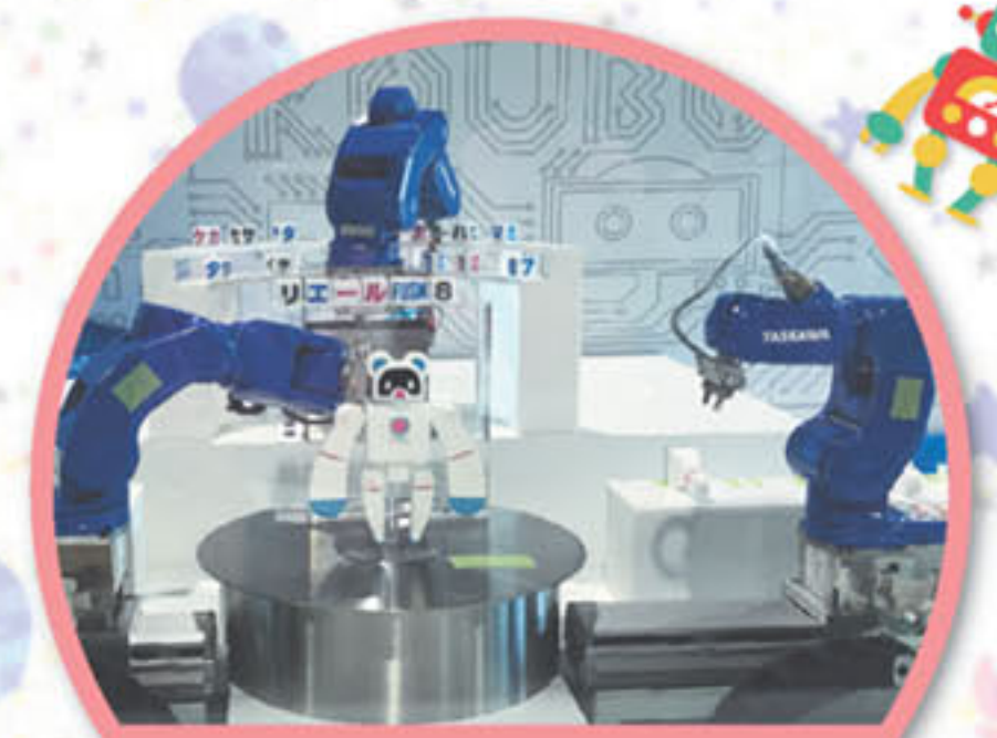
④ロボット・科学技術コーナー ロボット工房