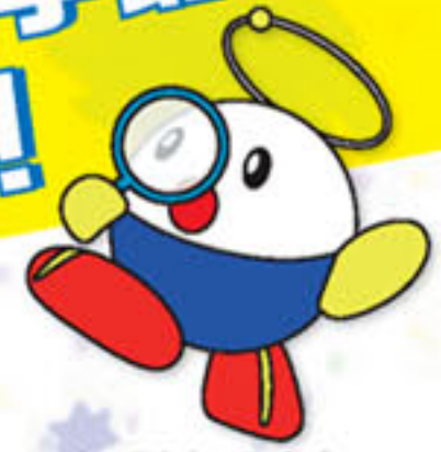
キャラクターロボット「くるめット」くん