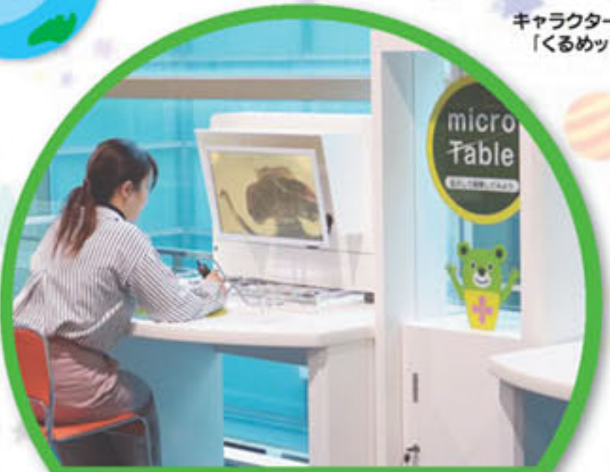
③自然と環境コーナー マイクロテーブル