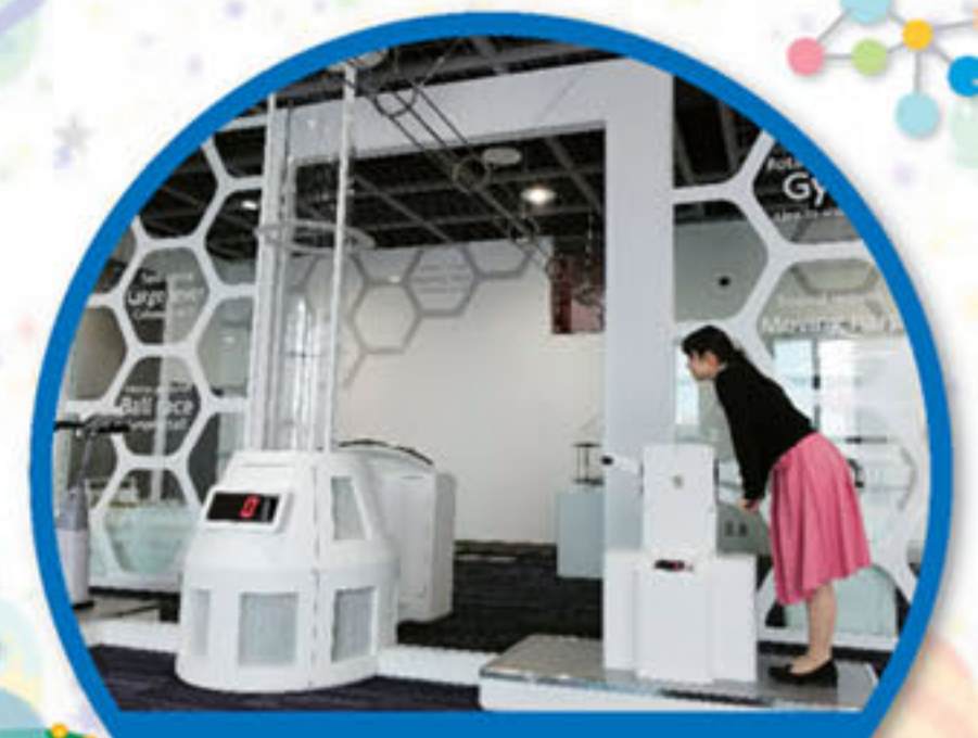
②礎となる科学コーナー フライングプロベラ