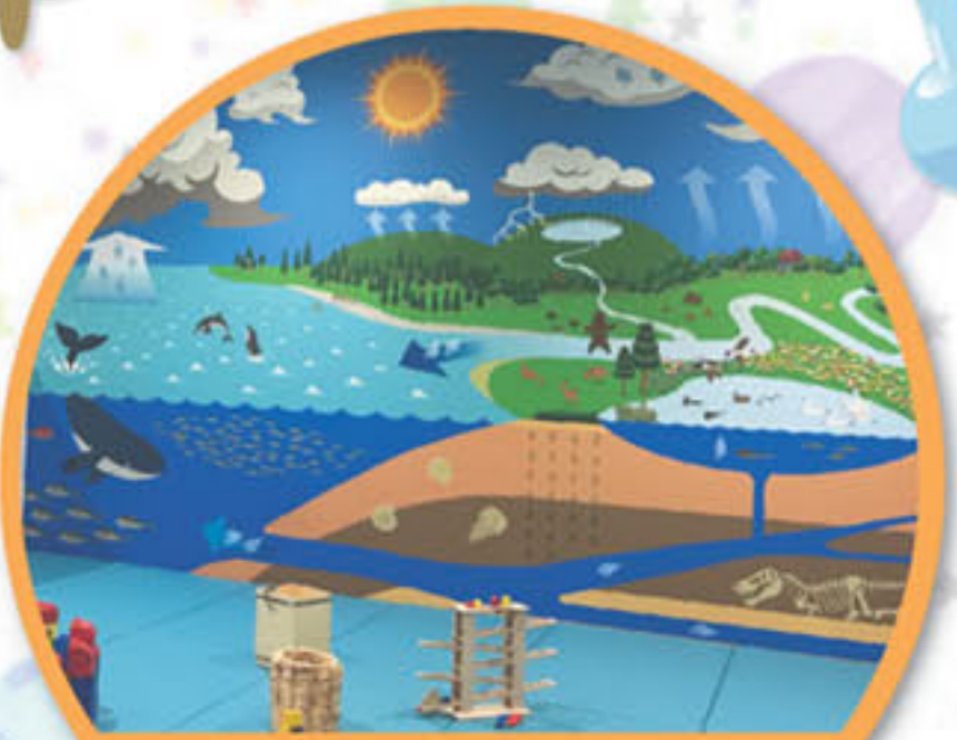
キッズコーナー「めばえ」